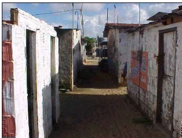
Figura TRA 52. Construções irregulares invadindo a faixa de areia