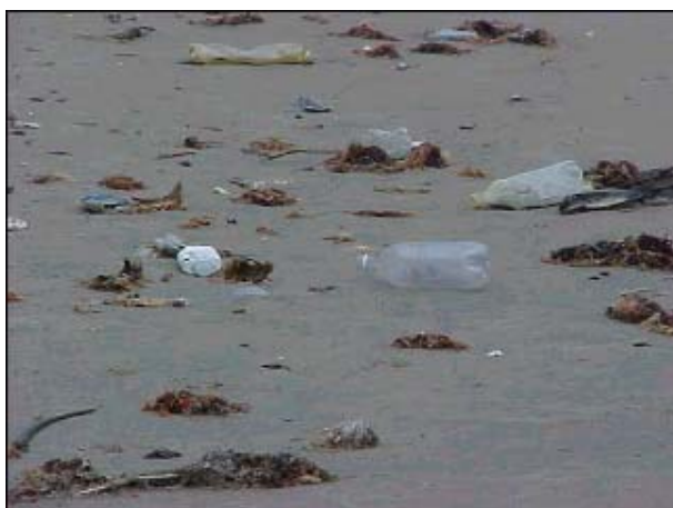
Figura TRA 68. Praia muito suja