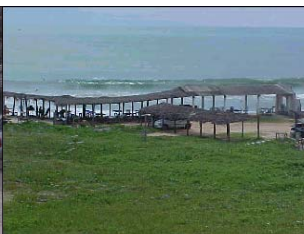
Figura TRA 67. Quiosques implantados desordenadamente, invadindo a faixa de areia