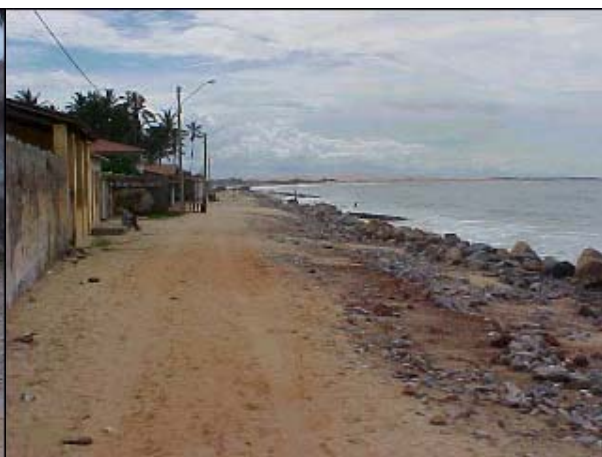
Figura TRA 73. Faixa de areia quase inexistente, presença de estrutura de gabiões protegendo a rua