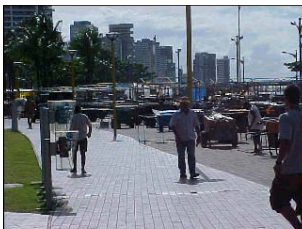
Figura TRA 55. Detalhe da feira de artesanato