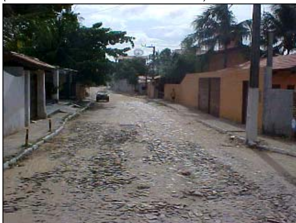
Figura TRA 70. Detalhe da rua principal do bairro que dá acesso à praia