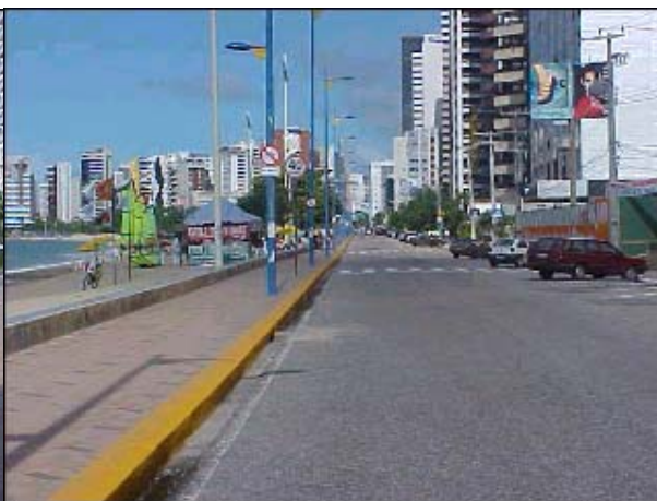
Figura TRA 54. Avenida Beira-Mar, contorna a orla