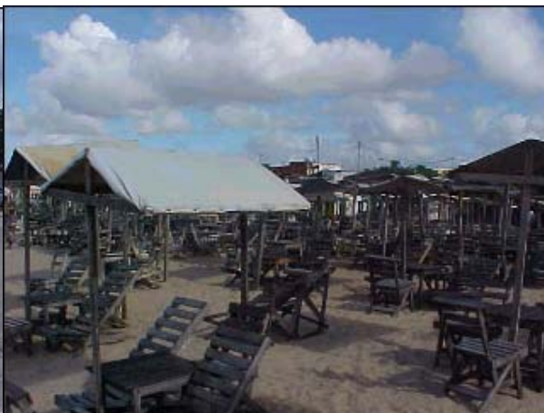
Figura TRA 51. Barracas dos bares invadindo a faixa de areia