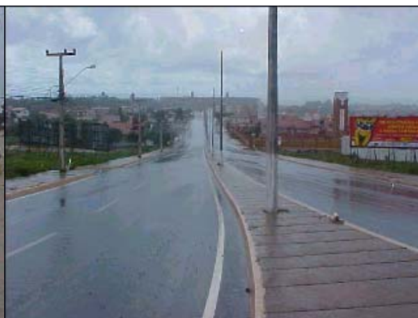
Figura TRA 91. Avenida principal de acesso ao Beach Park e à praia