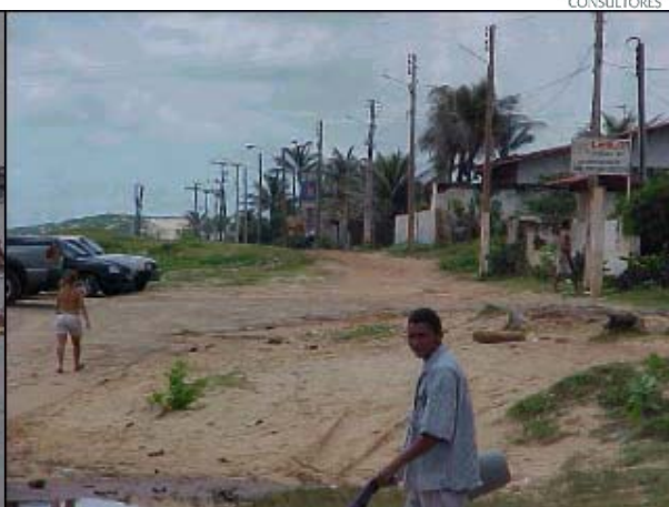
Figura TRA 69. Rua de contorno da praia sem estruturação de via pública