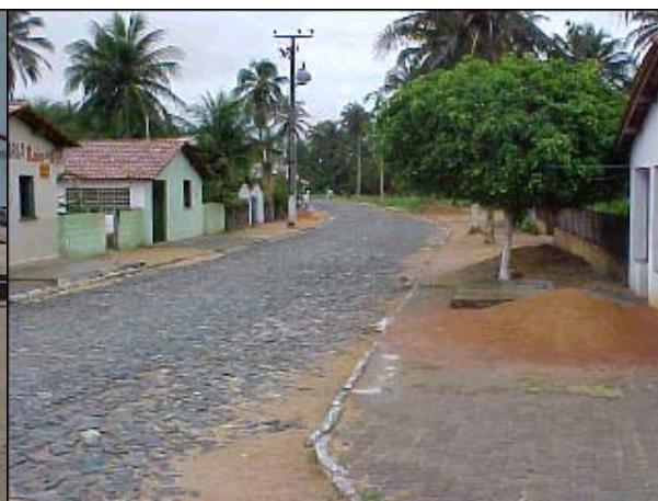
Figura TRA 79. Rua interna da vila, acesso principal à praia