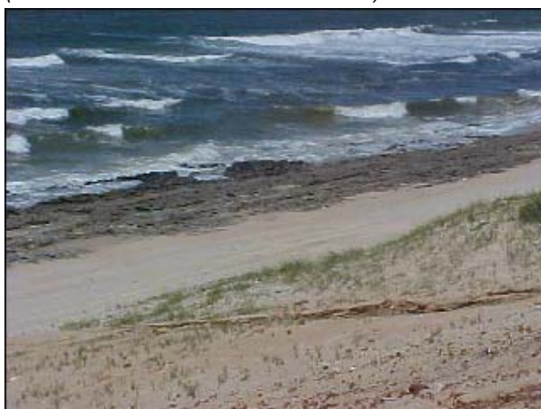
Figura TRA 62. Praia Limpa, com faixa de areia alternada com rocha