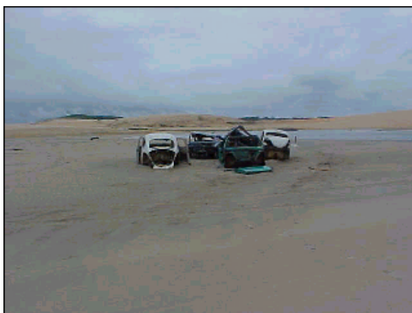
Figura TRA 80. Sucata de carros na faixa de areia