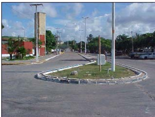
Figura TRA 50. Avenida de acesso à orla