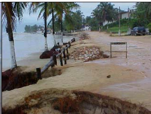
Figura TRA 83. Rua de contorno com problema de erosão causada pela maré