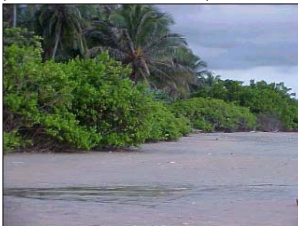
Figura TRA 84. Faixa de mangue junto à praia