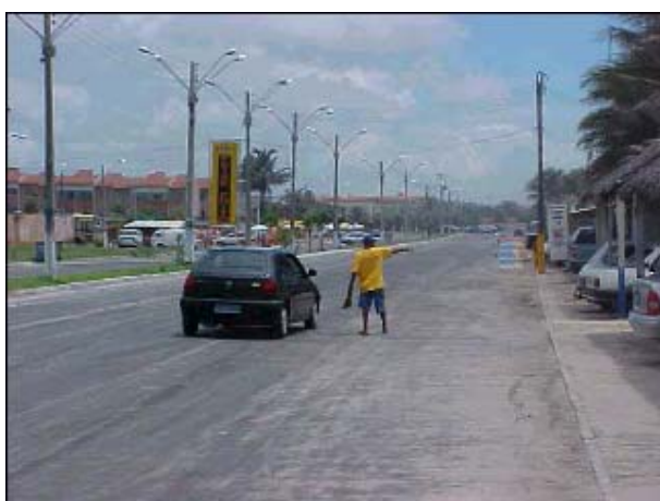
Figura TRA 66. Detalhe da avenida à beira-mar