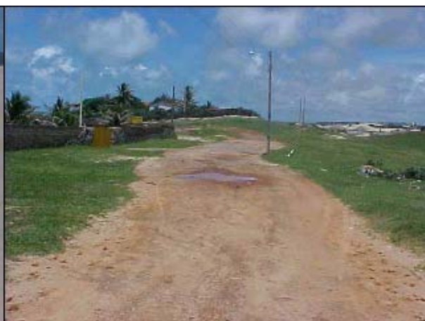
Figura TRA 61. Acesso sem estruturação de via pública