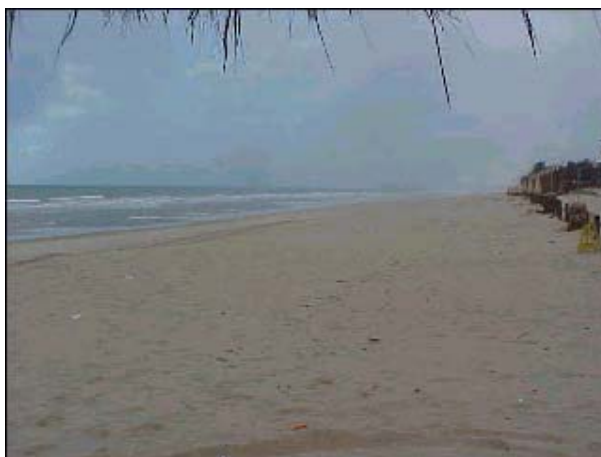
Figura TRA 90. Praia com faixa de areia larga e limpa