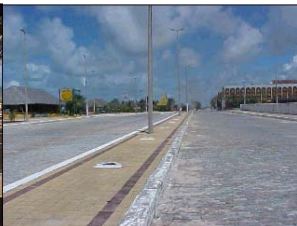
Figura TRA 59. Avenida principal, com pavimentação em pedra poliédrica