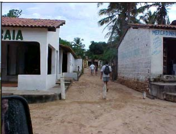
Figura TRA 87. Detalhe das ruas paralelas à praia, estreitas e só com passagem para pedestres