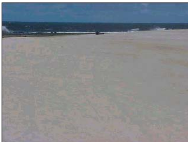
Figura TRA 60. Praia limpa, conjugada com a Barra do Rio Cocó