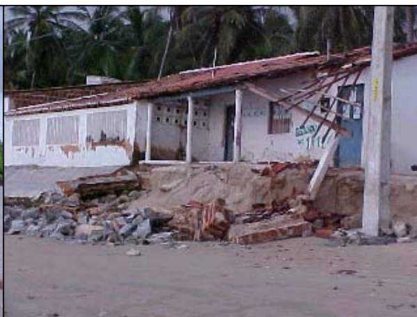
Figura TRA 85. Erosão nas edificações, junto à faixa de areia, causada pela maré