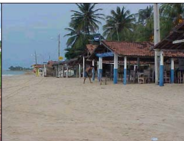
Figura TRA 75. Estrutura de apoio do restaurante na faixa de areia