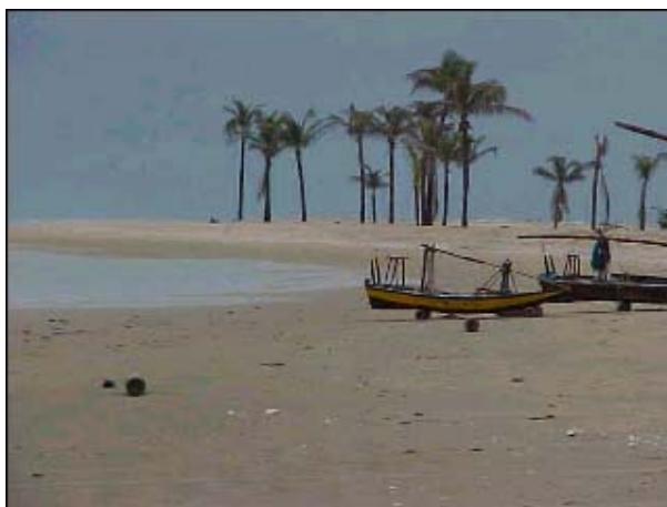
Figura TRA 78 Praia com larga faixa de areia, quase primitiva