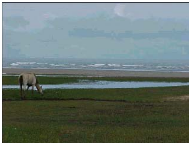
Figura TRA 86. Praia limpa, quase desértica