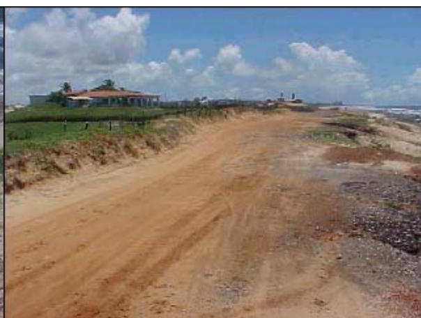
Figura TRA 63. Acesso precário que liga a praia à estrada principal de Sabiaguaba