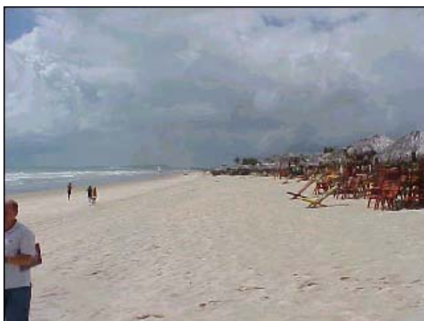
Figura TRA 88. Praia com faixa de areia larga e limpa