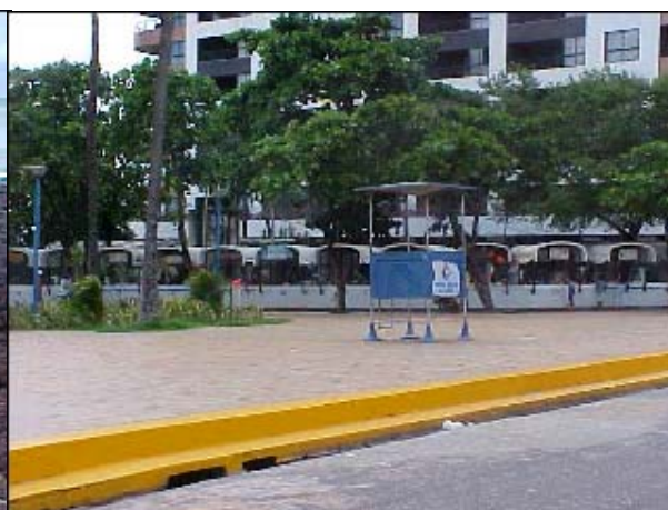
Figura TRA 57. Detalhe dos boxes no mercado de peixes