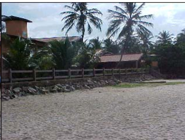
Figura TRA 71. Casa de alto padrão com acesso exclusivo à praia