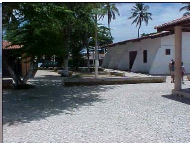
Figura TRA 65. Praça pública na região da orla