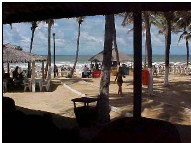
Figura TRA 58. Estrutura de apoio existente na praia