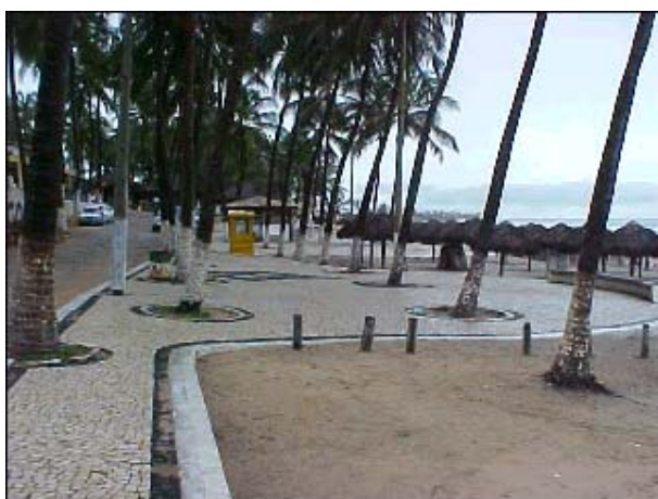
Figura TRA 76. Detalhe do passeio público junto à praia