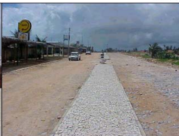
Figura TRA 89. Avenida Beira-Mar está sendo pavimentada com pedra poliédrica