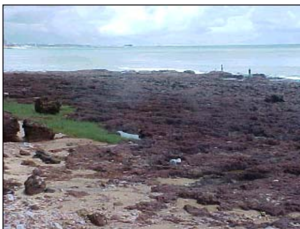
Figura TRA 56. Existência de rocha na faixa de areia