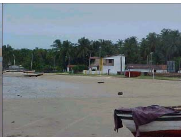
Figura TRA 81. Detalhe da casa de veraneio junto à praia