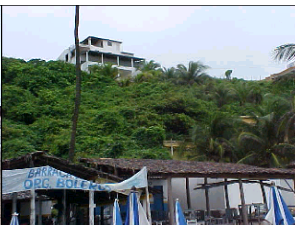
Figura TRA 77. Encosta protegida pela vegetação