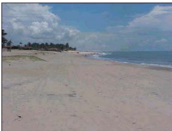
Figura TRA 64. Praia de larga faixa de areia com alguns pontos de sujeira