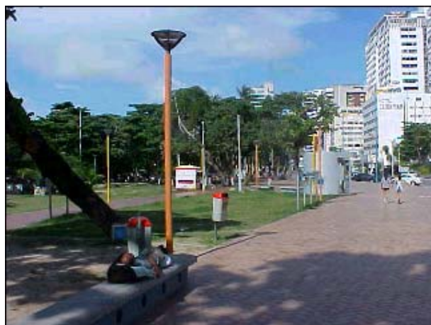
Figura TRA 53. Passeio público, detalhe do ajardinamento