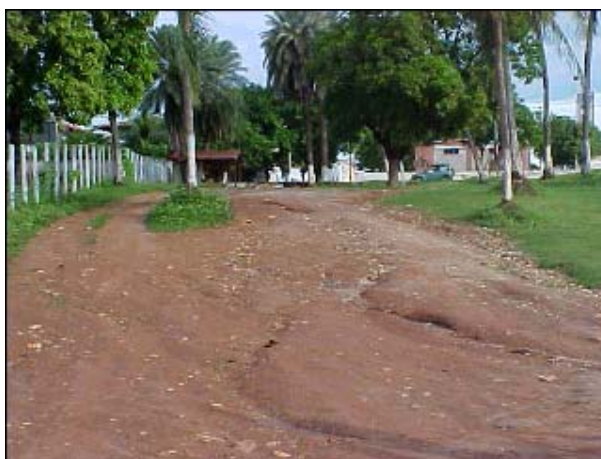
Figura TRA 74. Acesso secundário à praia, região central da cidade