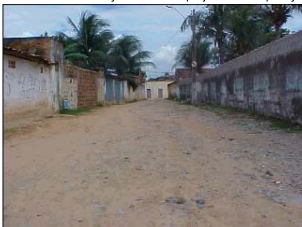
Figura TRA 72. Ruas de acesso à praia, estreitas e ortogonais

* Sistema de contenção da Maré –projeto de recuperação PRODETUR/CE I