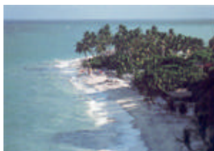
Praia do Seixa – João Pessoa