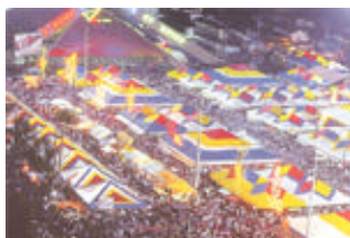
O Maior São João do Mundo/Pq. Do Povo