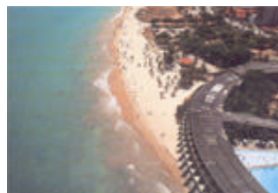
Praia de Tambaú