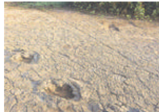
Vale dos Dinossauros