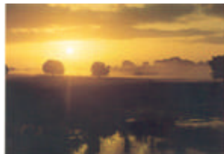
Nascer do Sol em Bananeiras