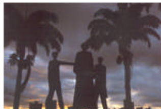
Tropeiros de Borborema