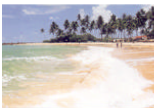
Praia do Coqueirinho – Conde